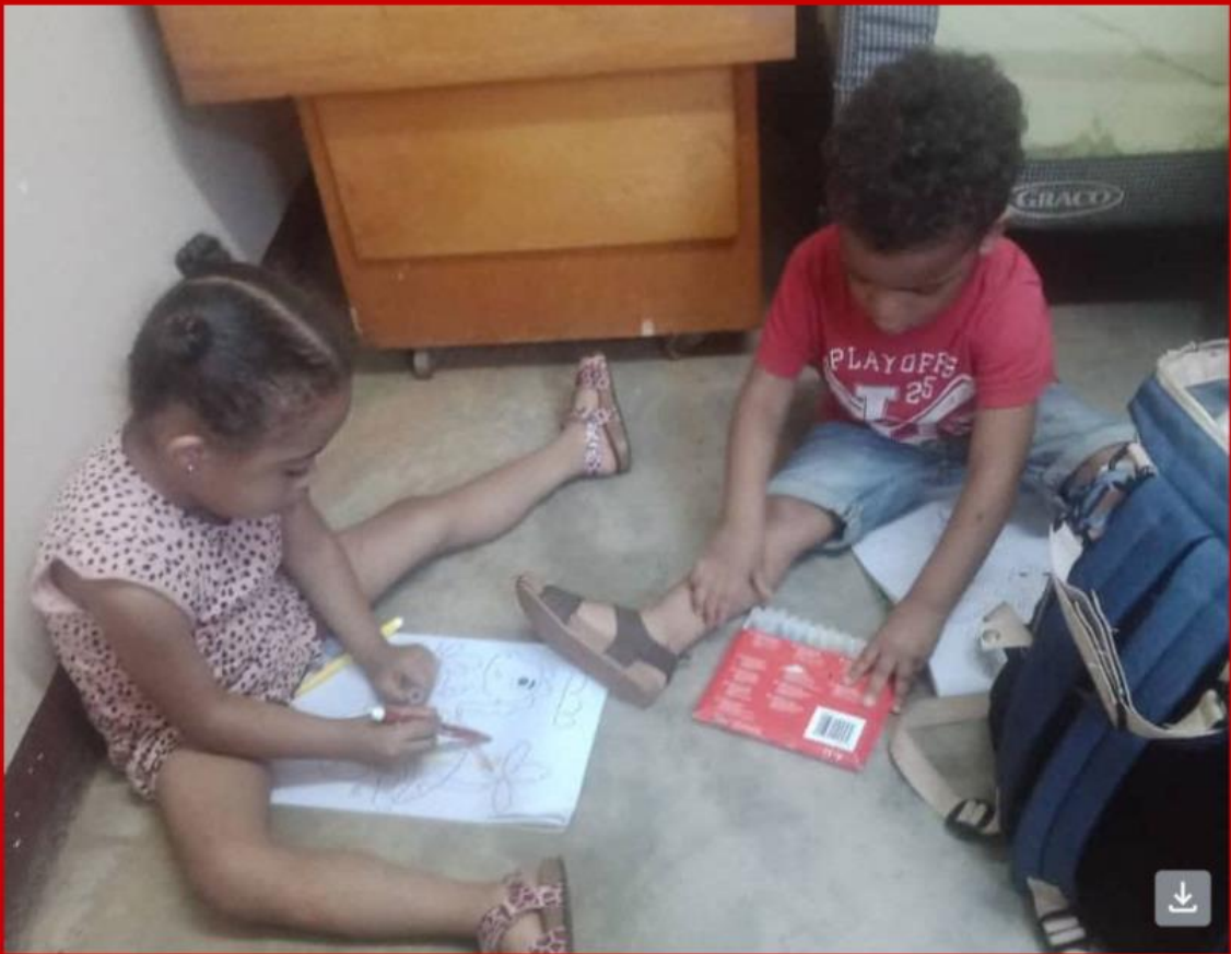
Zoet aan het kleuren terwijl mama werkt