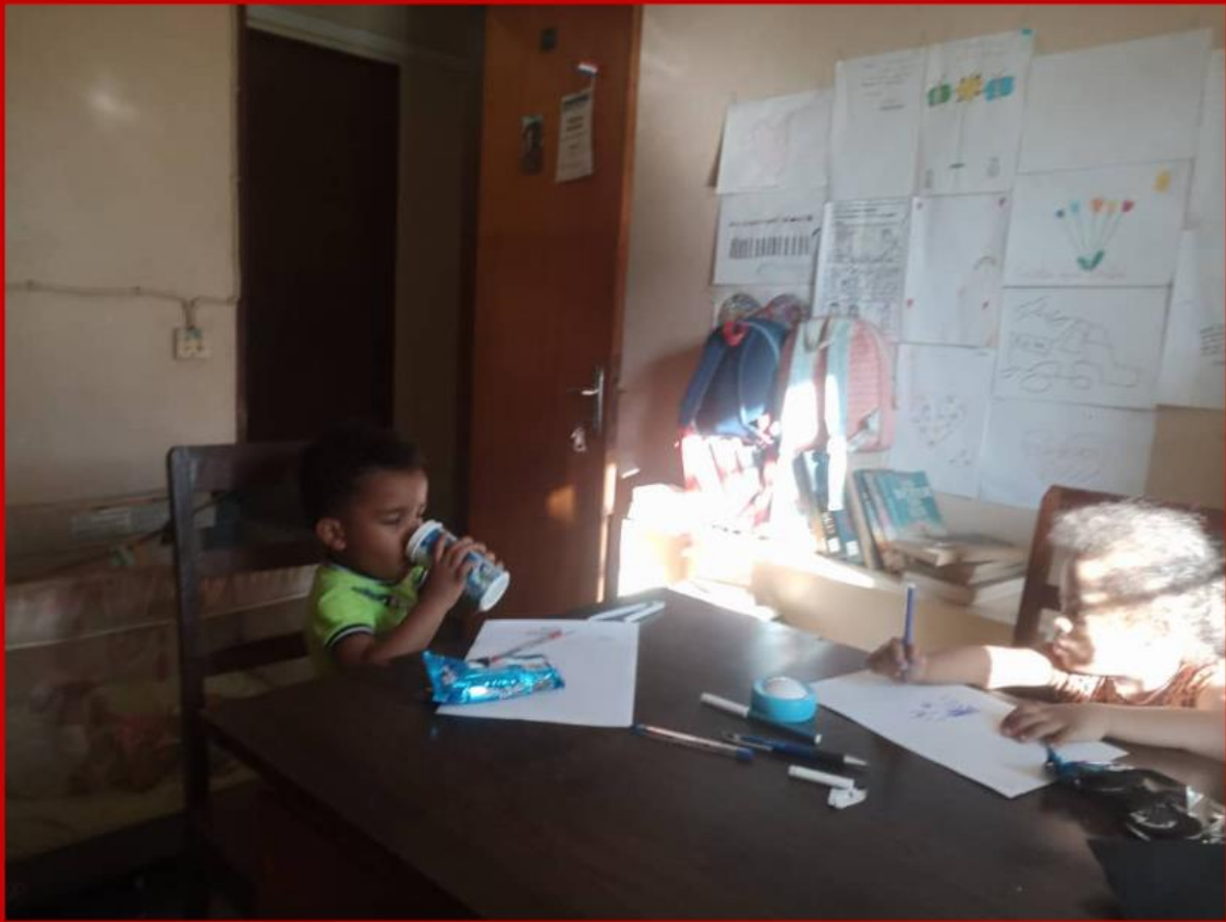
Alternatieve crèche: de kids op kantoor