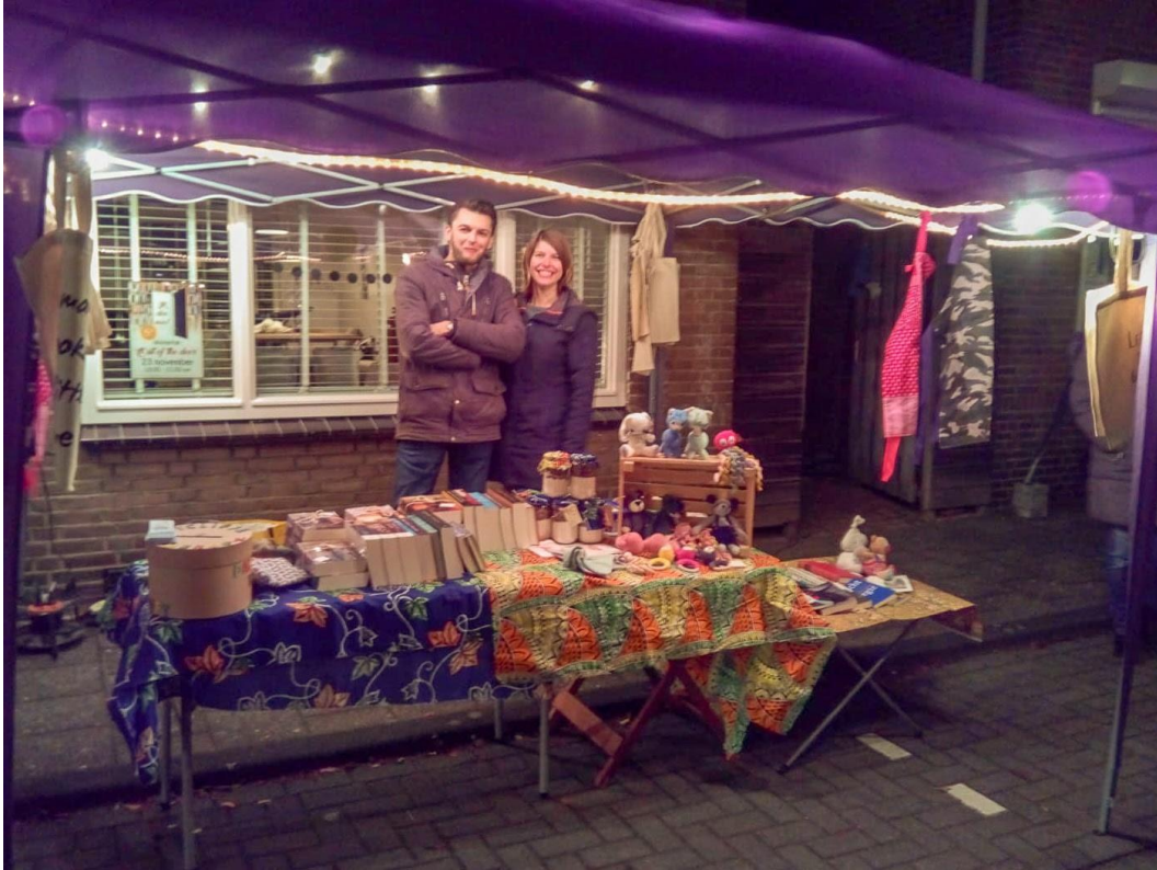
Winterfair in Sliedrecht