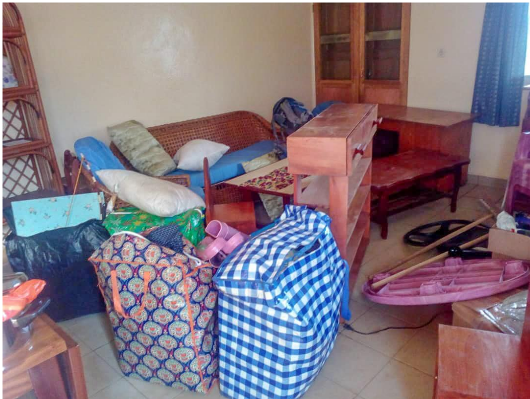
Halverwege de verhuizing...

zullen proberen te komen en dat er financiële middelen om hen daarbij te helpen gevonden zijn. 3 december hopen we te beginnen met lesgeven. Het zal een hele intense periode worden, vooral voor de studenten, omdat we maar beperkt de tijd hebben om alle benodigde informatie en kennis over te brengen.