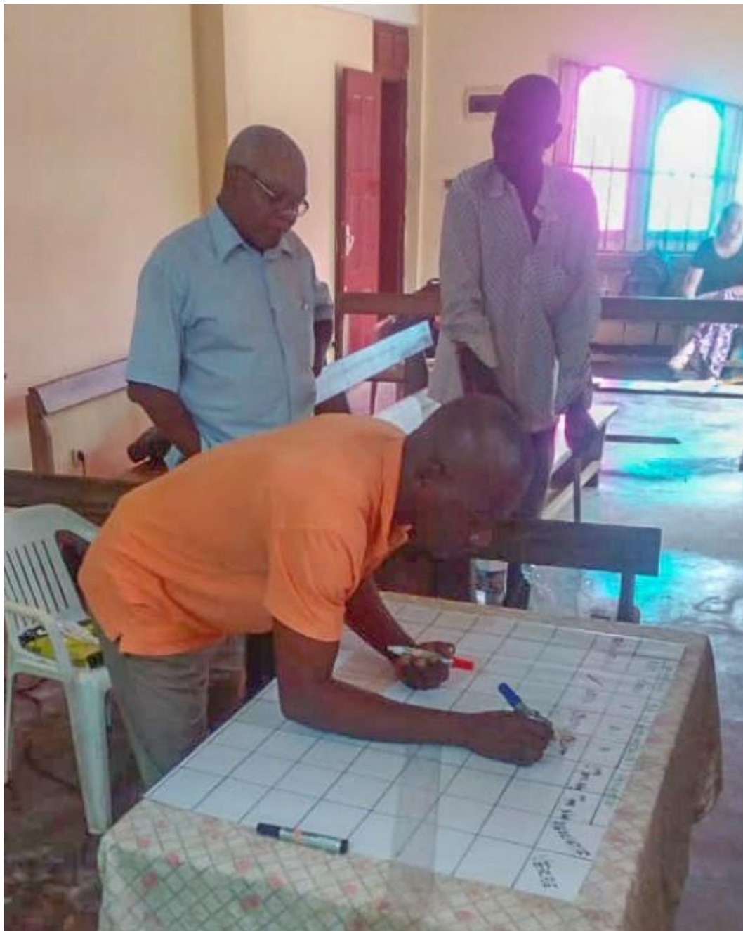
Hard aan het werk