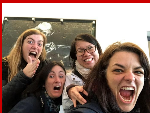
Aan het einde van een lange dag...

Het gebruik van een taal is niet zomaar recht door zee; wat iemand bedoelt kan verkeerd begrepen worden door een ander. En het is erg belangrijk om hier rekening mee te houden, vooral bij het vertalen van de Bijbel. Tijdens het vak Translation hebben we geleerd hoe we de Bijbel kunnen vertalen, welke computerprogramma's we kunnen gebruiken, maar ook hoe we rekening kunnen houden met een cultuur in een Bijbelvertaling om zo het begrip van een Bijbelgedeelte te bevorderen. Ik heb voor de eindopdracht van dit vak Spreuken 9 in het Nederlands vertaald.