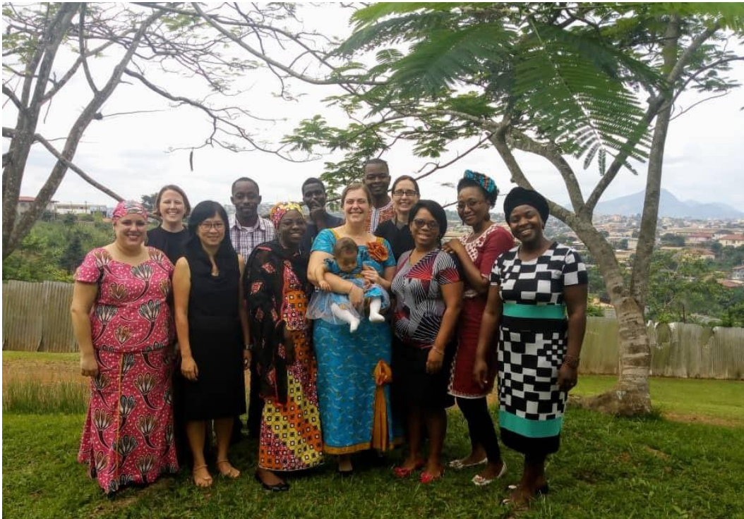
Nous sommes ensemble

Mijn werk met de Mengisa (Njowi) vordert ook gestaag. Het eerste gedeelte van de grammatica van het Njowi is af en gecheckt door een consultant. Nu zijn we bezig aan het tweede en laatste gedeelte van de grammatica dat over werkwoorden gaat. Ook is mij twee weken geleden ook gevraagd of ik een fonologie wil maken. Voor deze fonologie kijk ik naar de klanken in de taal en de toon en kijk ik in welke volgorde de klanken voorkomen en wat er gebeurt met toon. Aan de hand daarvan zal ik vervolgens ook een orthografie maken.