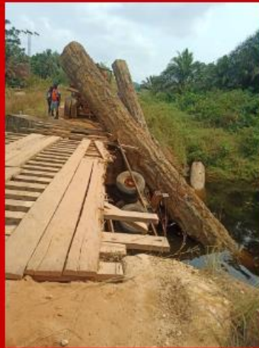
Oponthoud onderweg naar de alfabetiseringsprojecten