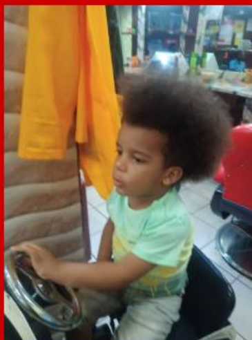
De eerste keer naar de kapper: vóór...