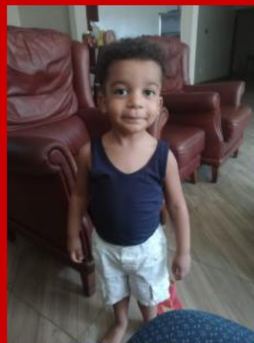
De eerste keer naar de kapper: nă!