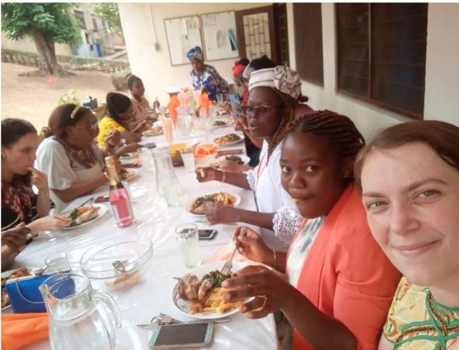
Internationale vrouwendag: voor het eerst ook gevierd met de vrouwen van SIL.

Tegenwerking. Verder werk ik nog verder aan Mengisa. Helaas is er wat tegenwerking vanuit een bepaalde groep sprekers die opeens niet meer willen dat er een Bijbelvertaling komt. Zou u willen bidden dat hun hart geraakt mag worden en we zo verder mogen gaan met het vertaakproject? Bid ook voor wijsheid, dat we mogen weten hoe we hier goed mee om mogen gaan en dat we de juiste beslissingen zullen nemen (doorgaan of het project tijdelijk stilleggen).