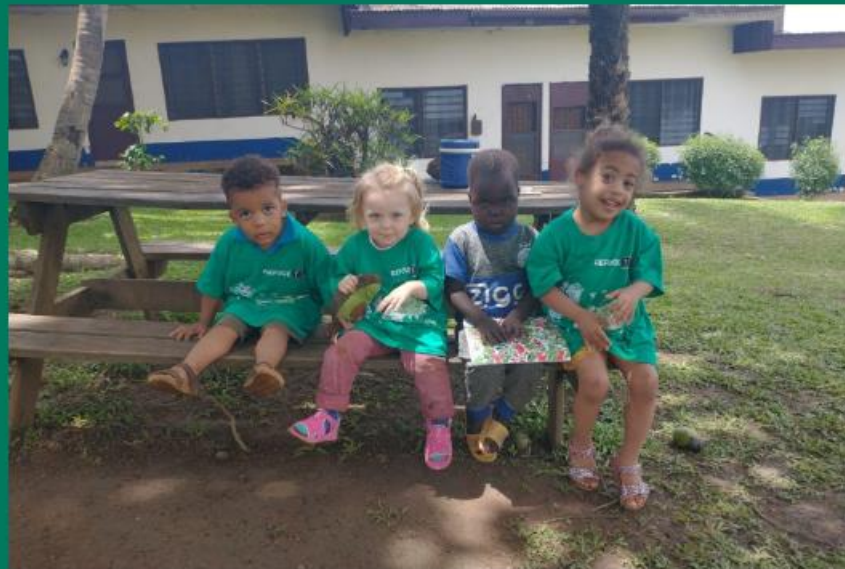
De kids tijdens de conferentie in tenue