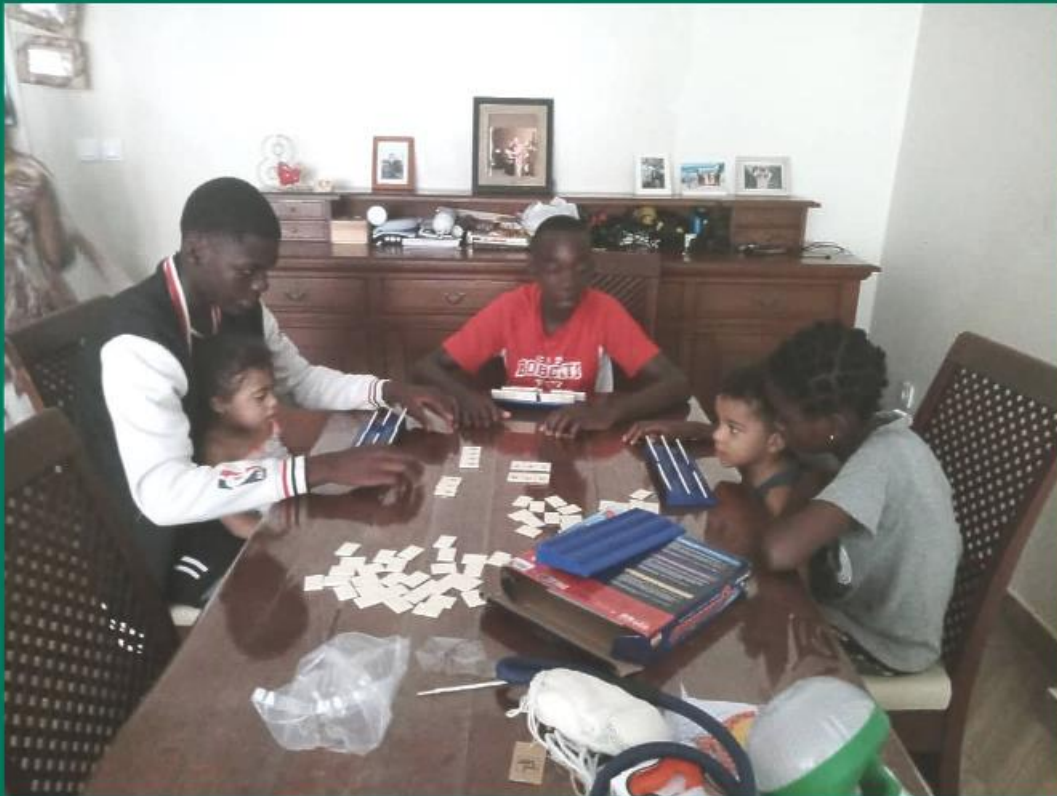
Neefjes en nichtje aan de Rummicub