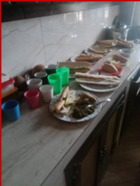
Ontbijt voor 10!

In de Gemeente Sliedrecht was er een aantal weken geleden een Mannenzangavond georganiseerd. Tijdens die avond is er voor ons gecollecteerd en is er een mooi bedrag opgehaald. We zijn hier heel dankbaar voor. Ook vanuit de Marekerk hebben we een bedrag van een collecte ontvangen. Bedankt hiervoor!