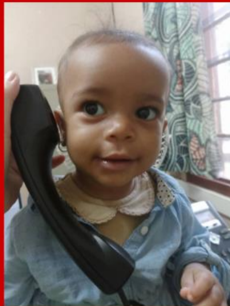
Mijn secretaresse :)